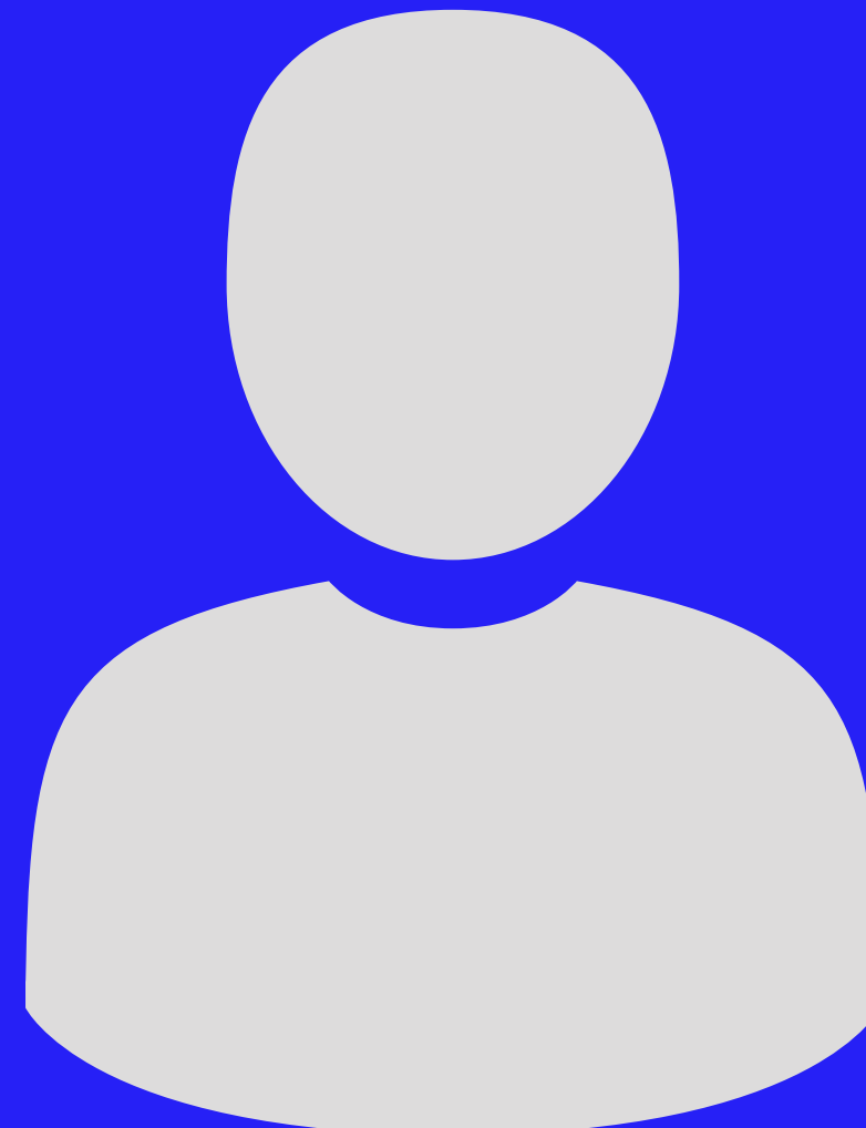
NO AGUARDO Estagiário de audiovisual